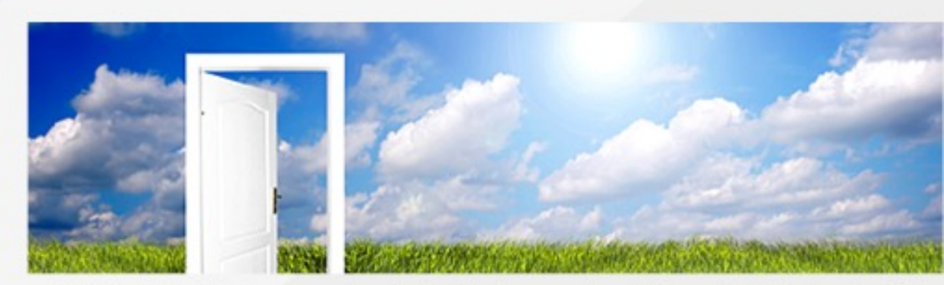
Erfolgreiche Veränderung beginnt mit einem ersten kleinen Schritt, der die Tür zu einer besseren Wirklichkeit öffnet.

Jeder Coachingprozess endet mit einer abschließenden Auswertung . Ergebnisse und Entwicklungsschritte werden strukturiert zusammen getragen, so dass die Klienten optimale Voraussetzungen erhalten, die gewonnenen Erkenntnisse nachhaltig zu nutzen. In Unternehmenskontexten können bei Bedarf auch Dritte (z.B. Führungskräfte, Personalentwickler, Coachingbeauftragte) zum Auswertungsgespräch hinzugezogen werden.