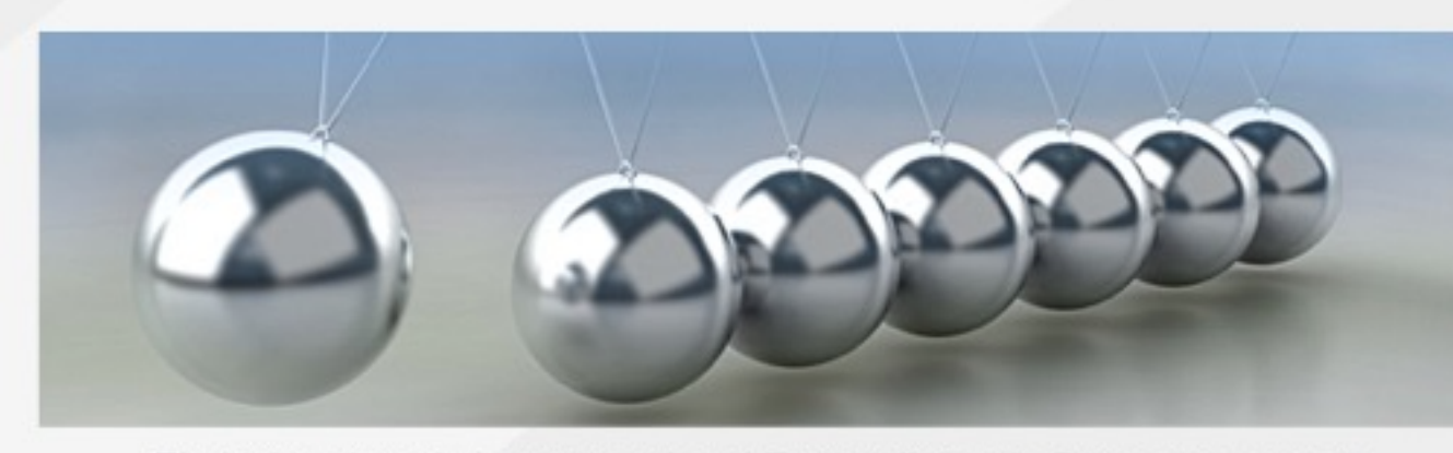
Ein kleiner Impuls kann manchmal Erstaunliches in Bewegung setzen.